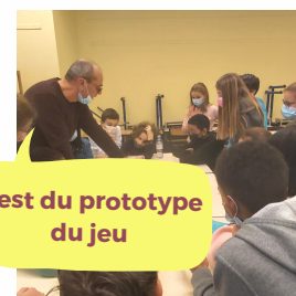
Test du prototype du jeu