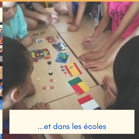
...et dans les écoles