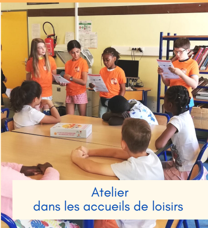
Atelier dans les accueils de loisirs